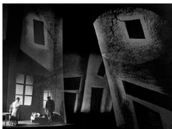
Vojcek (A. Berg), 1959 Wozzeck Režie / Directed by F. Pujman