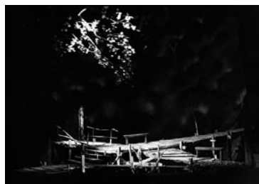
Bouře (A. N. Ostrovskij), 1941 The Storm Režie / Directed by F. Salzer